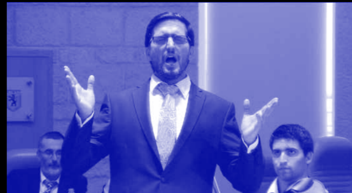
כתוביות פה שורה שניה של כתוביות

המהלך הזה של שיבוש מעשה התרגום - באמצעים של הזרה ומשחקיות - מאפשר מבט ביקורתי על תהליך התיווך עצמו. קרן מדגישה את הממד הזה על ידי בחירה של משפטים מסוימים מתוך