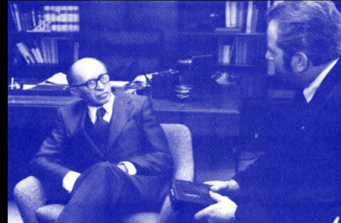
Israeli prime minister Menachem Begin and pastor Jerry Falwell in a meeting, Israel 19XX.