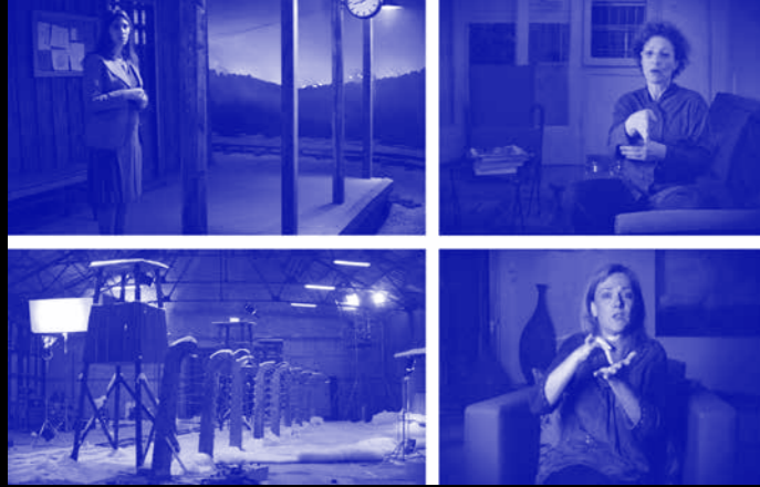
כתוביות פה שורה שניה של כתוביות

קטעי מצלמה נעה, אשר צולמו בחלל שנבנה במיוחד לעבודה וכולל דגם בקנה מידה 1:1 של מסילת ברזל ותחנת רכבת. הדגם כמעט זהה למקור, אך כמו העדות גם הוא ייצוג, והאופן שבו נעה המצלמה על המסילה המאזכרת את ה"דולי", שעליו נעה המצלמה מנכיח את הדימוי כאמצעי מתווך הפועל לצד ובתוך הטקסט.