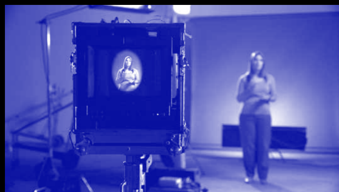
The Interpreter, 2013. Video still Multi-channel video installation, 26 min.