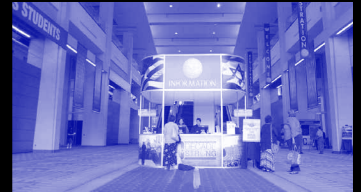
Christian United for Israel (CUFI) summit 2015, Washington D.C. (Keren's research archive)

Keren's research-based works involve collaboration with extra-artistic agents: Municipalities, political bodies, public and religious functionaries, academics, and others. These interactions result in a combination of video footage and performative elements. The status of the written or spoken text, the negotiations it undergoes by different social agents and the way in which its meaning is articulated vis-à-vis these performative modes are the works' underlying problematics. An early example of Keren's preoccupation with the performative status of a text is found in her multi-channel video work The Interpreter (2011), which was based on Claude Lanzmann's monumental film Shoah . Upon its release in 1985, the film aroused great interest mainly because of Lanzmann's decision to forego archival footage and base the film in its