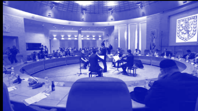
New Jerusalem, 2015. Still from performance. Multi-channel video installation and performance

it?), but also about the way in which various instances of giving testimony offer different sets of encoding, through which the event is experienced. Whereas Shoah undermined familiar cinematic conventions by giving precedence to the speaking word over the moving image, Keren's work scrutinizes the role of testimony in the creation of historical narrative by image-makers (film directors) and wordsmiths (historians). The theatrical performativity of the sign-language interpreters is in itself a translation of the subjective voice commentary given by the readers of the text, which, in turn, was taken from a filmed testimony that actually presented a contemporary and personal take on past events and current memories. Together, all of these aspects point to the fluidity and fragility of the relations between social processes, their negotiation, and the collective and personal implications of such a dynamics.