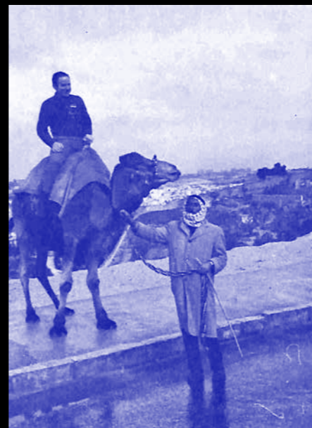
כתוביות פה שורה שניה של כתוביות